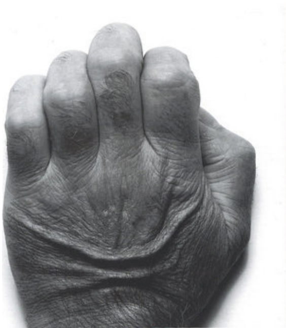
John Coplans, Self Portrait, Back of Hand , 1986