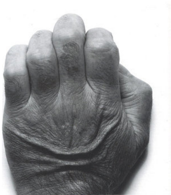
John Coplans, Self Portrait, Back of Hand , 1986