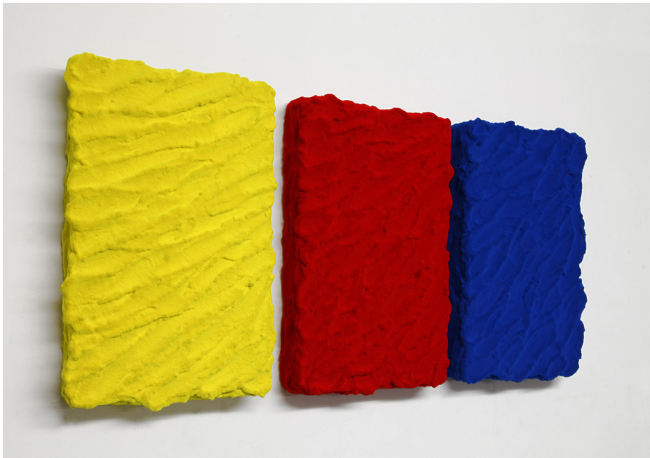
Pittura G. R., BL., 2012; Mixed media, 72 x 36 cm