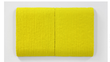
Pittura G., 2005; Mixed media, 40x 60 cm

"As with my third eye, I would like to reach the atomic substance of form, as an element of strength and constitution of a different kind of painting"