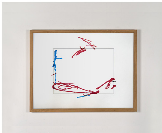
Links: André Stempfel, l'igine 2 , 2019. Acrylique sur panneaux / Acrylic on canvas. 100 x 80 cm. Rechts: Mary Sue, Practice 3 , 2019. Color marker on paper and passepartout. 30 x 40 cm.

In reactie op de gevolgen van de Covid-19 pandemie voor de culturele sector, gaat TMH door met het bieden van een podium voor haar vele kunstenaars. Ze maken weliswaar heel verschillend werk, maar de vijf kunstenaars in deze generatieoverschrijdende tentoonstelling delen een voorliefde voor materiële textuur en een niet-lineaire geometrie om met kleuren tot een krachtige beeldtaal te komen. Dit is avontuurlijke en spraakmakende kunst op haar best.